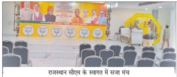
राजस्थान सीएम के स्वागत में सजा मंच