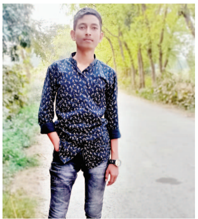
मृतक की फाइल फोटो