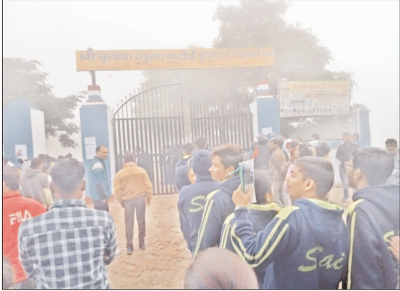
कारवाई की। इसके अलावा भी जिला विद्यालय निरीक्षक द्वारा विभिन्न परीक्षा केंद्रों का निरीक्षण किया परंतु