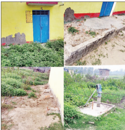
तो वया मरम्मत के नाम पर हो गया घोटाला

इमलिया सुल्तानपुर-सीतापुर (स्पष्ट आवाज़)। तिहार में बना सामुदायिक शौचालय तीन वर्ष बीतने के बाद भी क्रियाशील नहीं हो सका है। सचिव की इस बात को स्वीकार कर रहा है। इससे प्रतिरोत है कि पूरे में विकास निधि का दुस्चयोग कर शासकीय धरणी का बन्दर बन्द हुआ था। जहाँ मौजूद सम्य मरामत कराने व सौट लावने की बात स्वयं सचिव नवल किशोर बता रहा है। परन्तु मौके पर कुछ भी नया कार्य नहीं दिख रहा है। ऐसे में मरम्मत के नाम पर वा शासकीय धरणी का नये सिरे से बन्द बंद हो गया। जो जांच का विषय है। अवर देखा है कि इसी ग्राम पंचायत में मरगा से बनी नहरियापुर गाँव स्थित विद्यालय बाजूड़ी बाल की तरह जांच अनार को बनते हुये हवा झाड़ो तो नहीं हो जायेगी। बताते चलें सितम्बर 2023 में पूर्ण भूतान होने से पहले बाजूड़ी बाल की जांच की गयी थी। स्पष्ट आवाज ने उक्त खबर प्रचुरता से प्रकाशित की थी। जांच सहायक विकास अधिकारी (प) व अवर अधिनता को संयुक्त रूप से करना था। जांच हुई भी थी, लेकिन कार्यवाही की संस्तुति अब तक नहीं हो सकी है।