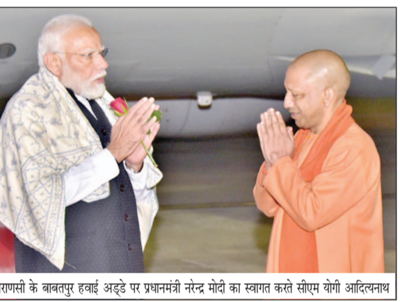
वाराणसी के बाबतपुर हवाई अड्डे पर प्रधानमंत्री नरेन्द्र मोदी का स्वागत करते सीएम योगी आदित्यनाथ

निर्माण के लिए भारत की ग्रामीण अर्थव्यवस्था का सशक्त होना जरूरी है। उन्होंने कहा कि हमने पहली बार पशुपालकों और मछली पालकों को भी किसान क्रेडिट कार्ड की सुविधा दी है। किसानों को ऐसे आधुनिक बीज दिए हैं, जो जलवायु परिवर्तन का मुकाबला कर सकें। भाजपा सरकार राष्ट्रीय गोकुल मिशन जैसे अभियानों के माध्यम से दुग्ध पशुओं की नस्ल सुधारने का भी काम कर रही है। प्रधानमंत्री ने कहा कि हम किसान कल्याण सुनिश्चित करने में कोई कसर नहीं छोड़ रहे हैं। सरकार ने देश भर में 60,000 से अधिक अमृत सरोवर बनाए हैं। इसी पहल से न सिर्फ