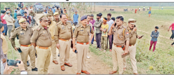
जिसको उंगली पकड़ कर चलना सिखाया उसी ने किया कल्ल