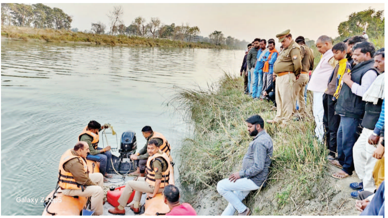
नहर में शव को तलाशती एनडीआरएफ टीम