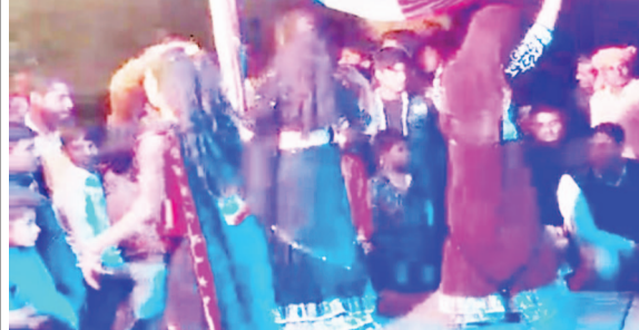
स्टेज पर ठुमके लगाती डांसर

■ घायल के भाई का था तिलक और बहन की आई थी बारात ■ कई राउंड हर्ष फायरिंग के बाद हुई वारदात, बेखबर बनी रही पुलिस ■ अविध असलहा भी बरामद न कर सकी पुलिस, घायल लखनऊ रेफर ■ सीलहापुर गाँव का मामला, वारदात को छिपाने में जुटी बीट की पुलिस