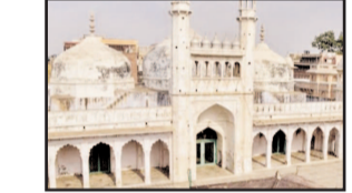
त्यास जी तखाने में नमाज

चुनाव जीतने का एक ही तरीका है, हम अपने बूथ पर ध्यान दें। बूथ जीते तो सब जीते। बूथ पर हम जितना संसक और सामर्थ्यवान हैं, परिणाम जना ही अनुकूल आएगा। हमारे संगठन का दायरा बढ़ा है। ऐसी स्थिति में हमें भाजपा के पक्ष में 80 में से 80 सीटें प्राप्त करना है। उन्होंने कहा कि बीजेपी का कार्यकर्ता संकल्पित होकर आगे बढ़ेगा तो इस परिणाम को कोई रोक नहीं सकता। मुख्यमंत्री ने कहा कि सच्चा लोकतंत्र वही है, जहां जनता का शासन, जनता के द्वारा, जनता के लिए होता है और जनता का शासन जनता के सुझावों से ही प्रारंभ होता है। उन्होंने कहा कि बीजेपी घोषणा पत्र नहीं, बल्कि संकल्प पत्र के साथ जनता के पास जाती है। जनता को जनार्दन के रूप में मान्यता देकर हम उसकी उपसना और सेवा करते हैं। जनता की अपेक्षाओं को अपने जीवन का संकल्प मानकर हमारे 5 साल की कार्ययोजना बनाते हैं और उसी पर कार्य करते हैं।