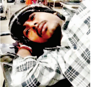
गोली लगने से जख्मी युवक

लोग कुछ समझ पाते, चीख-पुकार मच गई। पुलिस को सूचना देने के बाद परिजन अस्पताल आए। प्रारंभिक इलाज के बाद उसे जिला अस्पताल और फिर लखनऊ ट्रमा सेंटर के लिए रेफर किया गया। घायल ने गाँव के ही एक व्यक्ति पर पुरानी रंजिश में गोली मारने की बात कही है। वहीं पुलिस हर्ष फायरिंग के दौरान खुद के अविध असलहा भी बरामद नहीं कर सकी।