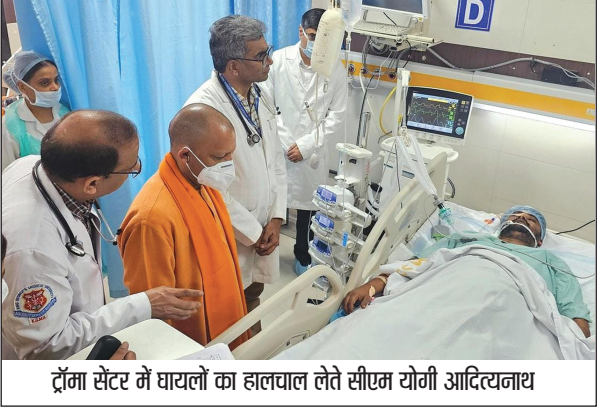
ट्रॉमा सेंटर में घायलों का हालचाल लेते सीएम योगी आदित्यनाथ

लखनऊ (स्पष्ट आवाज़)। लखनऊ में शनिवार रात सीएम योगी के काफिले को एक्सीडेंट कर रही कार हादसे की शिकार हो गई। कार से 15 लोग घायल हुए थे, इसमें घायल दो लोगों की केजीएमयू ट्रॉमा सेंटर में मौत हो गई। वहीं एक सिपाही सहित तीनों हालत भी बेहद गंभीर बताई जा रही है। 14 साल की प्रिया और 35 वर्ष की नीलम ने इलाज के दौरान तोड़ दिया है। सिपाही विजय कुशवाहा की हालत बेहद गंभीर है। फिलहाल यहां 7 मरीजों का इलाज चल रहा है। इनमें से 2 वेंटिलेटर पर हैं। रविवार सुबह सीएम योगी खुद केजीएमयू ट्रॉमा सेंटर पहुंचेंगे। उन्होंने घायलों से मिलकर उनका हाल-चाल जाना। योगी ने इलाज कर रहे डॉक्टरों से भी बात की। इस दौरान उनके साथ प्रमुख सचिव गृह संजय प्रसाद और डीजीपी प्रशांत कुमार भी मौजूद रहे। योगी ने भती शायल मरीजों से पूछा कि इलाज से संबंधित कोई परेशानी तो नहीं हो रही है? पहले से आराम तो है? इस