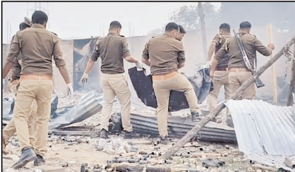
फैक्ट्री शहर से बाहर बनाई गई, लेकिन इसमें भी सुरक्षा मामलों को धात बतकर एक स्कूल से मात्र 100 मीटर पर बनाया गया। गनीमत यह रही कि रविवार होने के

कौशाम्बी जिले में रविवार को भवारी में संचालित पटाखा फैक्ट्री के अंदर हुए विस्फोट में 7 लोगों की जान चली गई। हादसे में फैक्ट्री मालिक की भी मौत हुई है। जिस स्थान पर घटना हुई, उसके 30 मीटर दूर तक मलबा बिखरा पड़ा हुआ है। जिनमें से 8 लोग अभी भी बदहवास हालात में हैं। वहीं अतिरिक्त दर्जन भर लोग घायल हुए हैं। जिन लोगों ने हादसे को नजदीक से देखा है, वह सदेम में हैं। प्रत्यक्षदर्शियों के मुताबिक, जब घटना हुई तब उसका मंजर बहुत ही भयावह था। हादसे में प्रशासन की बड़ी लापरवाही भी सामने आई है। 5 साल पहले भी इस फैक्ट्री में हादसा हुआ था। जिसमें 3 लोगों की जान चली गई थी। उस वक फैक्ट्री आबादी के बीच थी। बाद में