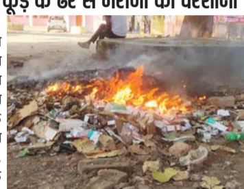
डलमऊ सामुदायिक स्वास्थ्य केंद्र में ही शासनोदेश के विपरीत कार्य किया जा रहा है। सामुदायिक स्वास्थ्य केंद्र में शनिवार को सफाई कर्मचारियों द्वारा मलहारा पट्टी

राष्ट्रीय लोक अदालत पर डीएम द्वारा निस्तारित किये गये 9 वाद बहराइच (स्पष्ट आवाज)। राष्ट्रीय लोक अदालत के अवसर पर जिलाधिकारी मौनिका रानी द्वारा 4 राजस्व वादों, 1 चक्रबन्दी वाद, 2 फौजदारी वाद व 2 स्टाम्प वादों का निस्तारण किया गया। स्टाम्प कमी के वादों का निस्तारण करते हुए जिलाधिकारी मौनिका रानी द्वारा रु. 13 लाख 1 हजार 550 की धनराशि को जमा कराया गया। लोक अदालत में नियत वादों में पक्षों के अधिवक्ता व जिला शासकीय अधिवक्ता (राजस्व) अजय शर्मा व विशेष अधिवक्ता (राजस्व) अतुल गौड़ उपस्थित रहे। अस्पताल में जलते कूड़े के ढेर से मरीजों को परेशानी डलमऊ, रायबरेली। (स्पष्टआवाज) पर्यावरण को हरा भरा व प्रदूषण मुक्त बनाने के लिए सरकार ने कूड़ा कचरा न जलाने के लिए सख्त निर्देश दिया है। इतना ही नहीं इसके बावजूद भी अन्ना पार्क कूड़ा कचरा जलता पाया जाता है, तो उसके विरुद्ध कार्यवाही के भी निर्देश दिए हैं लेकिन