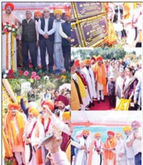
अगली पीढ़ियां रायबरेली की सांस्कृतिक विरासत को जान सकें और उस पर गर्व कर सकें। इस उद्यान में लगभग 3 किलोमीटर वाकिंग ट्रेक भी बनाई गई है, जो बेलें और पुष्पों से आच्छादित होंगी।