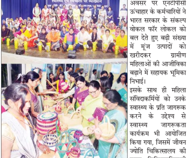
बनाए गए मूज के उत्पादों को बेचने का अवसर प्राप्त हुआ। उल्लेखनीय है कि इस

रायबरेली। (स्पष्टआवाज) एनटीपीसी ऊंचाहार में विभिन्न कार्यक्रमों में आयोजन के साथ धूमधाम से अंतर्राष्ट्रीय महिला दिवस मनाया गया। एनटीपीसी ऊंचाहार की महिला कर्मियों व प्रियदर्शिनी लेडीज क्लब की वरिष्ठ सदस्याओं के लिए एक वेबिनार का भी आयोजन किया गया। इस वेबिनार का विषय %इन्स्पिराएड इन्क्लूजन% रहा। महिला कर्मियों ने इसमें बढ़चढ़कर भाग लिया और कार्यक्रम को सफल बनाया। इस अवसर पर महिला सशक्तिकरण पर केन्द्रित एक प्रश्नोत्तरी का भी आयोजन किया गया। इस अवसर पर केके काटकर सभी का मुंह मीठा कराया गया। महिला दिवस के इस खास अवसर पर मूज क्राफ्ट प्रदर्शनी का भी आयोजन किया गया। जिसके अंतर्गत नैगम सामाजिक दायित्व के तहत चलने वाले मूज प्रशिक्षण के प्रशिक्षुओं को स्वयं