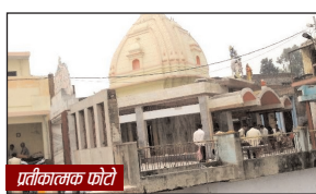
भाग, धतूरा आदि चढ़ाकर सुख समृद्धि की कामना की गई है। इस दौरान महाशिवरात्रि पर उपवास रखने वाले श्रद्धालुओं के लिए प्रसाद और फलाहार की व्यवस्था भी यहां पर की गई। गंगा किनारे कई सांस्कृतिक कार्यक्रमों का भी आयोजन हुआ।

कानपुर (स्पष्ट आवाज)। महाशिवरात्रि के पर्व पर जाजमऊ स्थित सिद्धनाथ मंदिर में श्रद्धालुओं का सैलाब उमड़ा। द्वितीय काशी के नाम से प्रख्यात सिद्धनाथ मंदिर में पर्व पर से ही दर्शनों के लिए श्रद्धालुओं की भीड़ उमड़ पड़ी। बाबा सिद्धनाथ के दर्शन की मनोकामना लिए हुए श्रद्धालु यहां पर घंटों कतार में खड़े रहकर अपनी बारी की प्रतीक्षा करते रहे। महादेव के जयनाद के बीच बाबा सिद्धनाथ का दूध और जल से अभिषेक कर उन्हें बेलपत्र,