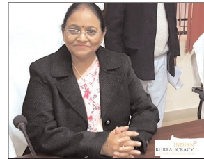
रिटायर्ड हुईं। सूचना आयुक्त शकुंतला गौतम मूलतः औरैया जिले के निवासी हैं। उन्होंने हमेशा लापरवाह और गैर जिम्मेदार कर्मचारियों के खिलाफ सख्त एक्शन लिया है।

कानपुर (स्पष्ट आवाज)। 2006 बैचकी रिटायर्ड आईएसएस अधिकारी शकुंतला गौतम को उत्तर प्रदेश सरकार में तीन वर्षों के लिए सूचना आयुक्त बनाया गया है। इसके पूर्व शकुंतला गौतम विभिन्न जिलों में जिलाधिकारी रहने के पश्चात जनवरी 2021 में नगरीय निकाय निदेशालय में निदेशक के पद पर नियुक्त हुईं। जून 2022 को कानपुर में श्रम आयुक्त का पदभार ग्रहण किया और 28 फरवरी 2023 को श्रम आयुक्त कानपुर के पद से ही