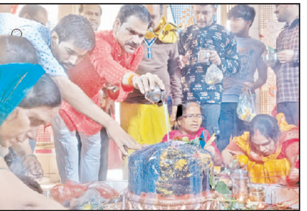
स्थित शिव मंदिर, मैहर धाम शक्ति व कृषि भवन परिसर स्थित शिवालय में जलाभिषेक व पूजन-अर्चन को उमड़ा पड़ा। बरसटी क्षेत्र के दिवावां नाथ महादेव मंदिर पर श्रद्धालुओं का रेला भी चला। त्रिलोक्य महादेव शिवमंदिर पर बाबा भोलेनाथ का जलाभिषेक और दर्शन-पूजन करने के लिए शिवभक्तों का जनसेलाब भीर में उमड़ पड़ा।

जौनपुर। महाशिवरात्रि पर्व पर पुरुवार को शिवालयों में जलाभिषेक करने के लिए श्रद्धालुओं का रेला उमड़ा रहा। भक्तों ने देवाधिदेव का विधि-विधान से पूजन-अर्चन व जलाभिषेक किया। नगर से लेकर ग्रामीण क्षेत्रों के मंदिर हर-हर महादेव के जयघोष से दिनभर गुंजता रहा। जगह-जगह रामचरित मानस पाठ, भजन-कीर्तन व भंडारे का भी आयोजन किया गया। ऐतिहासिक शाही पुल के बगल स्थित गोपी घाट पर भगवान भोलेशंकर व महावीर हनुमान मंदिर पर भव्य व्यवस्था की गई। गोपी घाट स्थित शंकर-हनुमान मंदिर के अलावा शाही पुल के ठीक नीचे स्थित गोमंतेश्वर महादेव को आकर्षक ढंग से सजाया गया नगर के बारीनाथ मठ स्थित शिव मंदिर, जागेधर नाथ मंदिर आलमगंज, गुररघाट स्थित शिव मंदिर, नवदुर्गा स्थित शिवालय, पक्का पोखरा