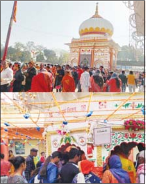
लोक कल्याण की कामना की। सुरक्षा की दृष्टि से मंदिर परिसर में भारी पुलिस बल तैनात रहा। रायबरेली जिले के लालगंज क्षेत्र स्थित बाबा बालेश्वर धाम मंदिर

रायबरेली। (स्पष्टआवाज) शुक्रवार को महाशिवरात्रि पर्व पर जिले के सभी शिवालयों में भक्तों की भारी भीड़ उमड़ पड़ी। सुबह भोर से ही शिवालयों में भारी संख्या में श्रद्धालुओं का पहुंचना शुरू हो गया, जो देर शाम तक चलता रहा। शिव मंदिरों को फूल मालाओं व झालों से विभिनत सजाया गया था। श्रद्धालुओं ने भगवान भोलेशनाथ के शिवलिंग पर जल, दूध, पुष्प और बेलपत्र चढ़कर भगवान अर्पण करने का जलाभिषेक किया। इस दौरान शिवालयों में हर हर महादेव और बम बम भोले के जयकारे गुंजते रहे। शिव भक्तों ने शिवलिंग पर जलाभिषेक कर